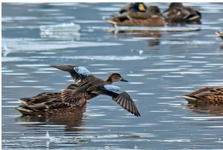
Obr. 1. Čírka modrokřídlá ( Spatula discors ), Tovačov (okres Přerov), 8. prosince 2023.

V dubnu 2023 byla čírka modrokřídlá zaznamenána po páté v Polsku (Komisja Faunistyczna 2024).