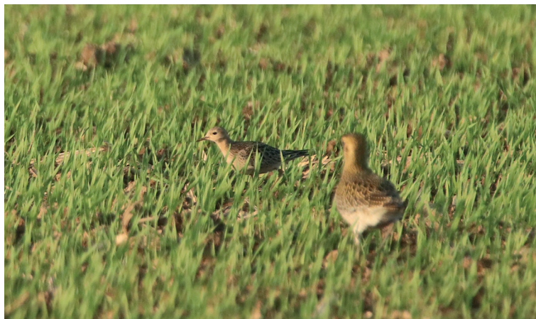
Obr. 2. Jespák plavý ( Calidris subruficollis ), Dlouhá Loučka (okres Olomouc), 30. září 2023.

Předchozí záznam pochází z října 2010, kdy byl mladý pták pozorován a chycen na úd. n. Rozkoš (Vavřík 2011).