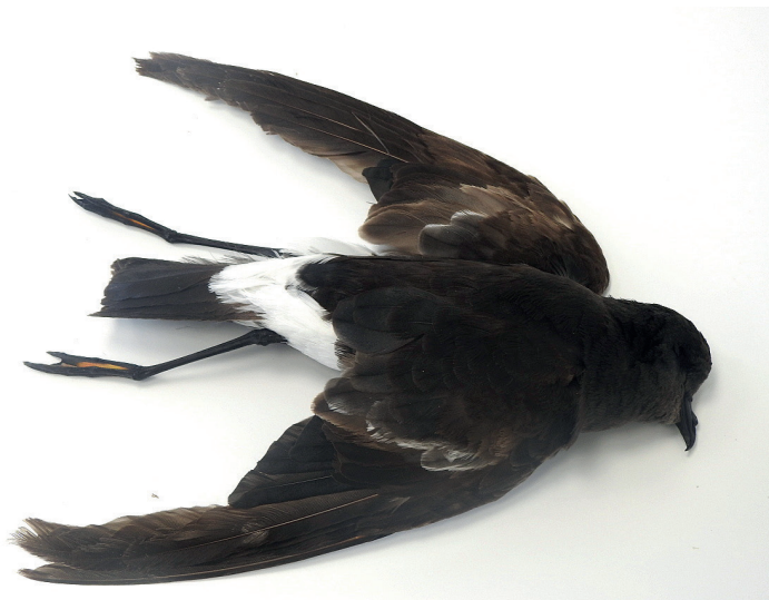
Obr. 5. Buřňáček Wilsonův ( Oceanites oceanicus ), sbírky Ornis Přerov, listopad 2023, pták byl nalezen vysílený 6. listopadu 2023, Hanušovice (okres Šumperk).

FK ČSO byla informována o nálezu „buřňáčka malého“ na parkovišti u obchodu v Hanušovicích; pták byl převzat pracovníky Záchrané stanice Ruda nad Moravou,