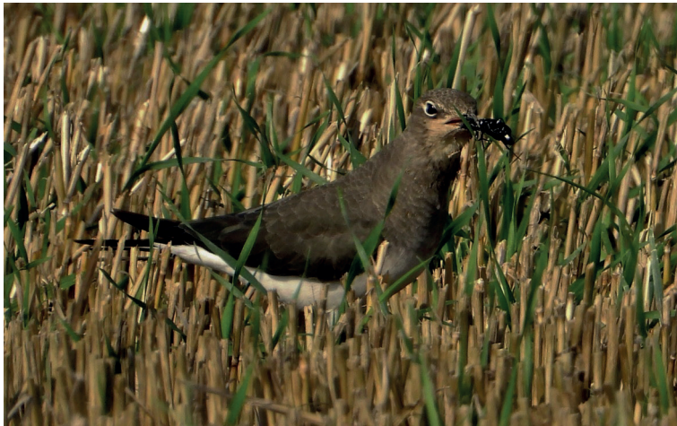
Obr. 3. Ouhorlík černokřídlý ( Glareola nordmanni ), Majetín (okres Olomouc), 2. září 2023.