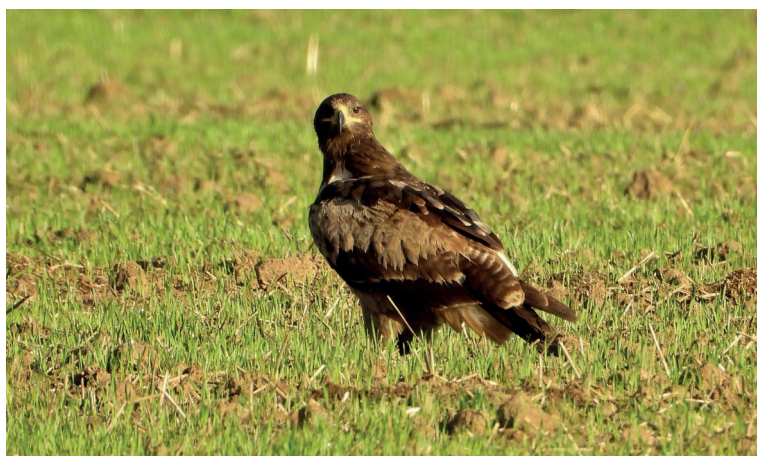
Obr. 6. Orel stepní ( Aquila nipalensis ), Skaštice (okres Kroměříž), 2. září 2023.

Zajímavé je, že v Polsku byl mladý (3K) pták zjištěn 24. srpna nedaleko ukrajinských hranic (Komisja Faunistyczna 2024).