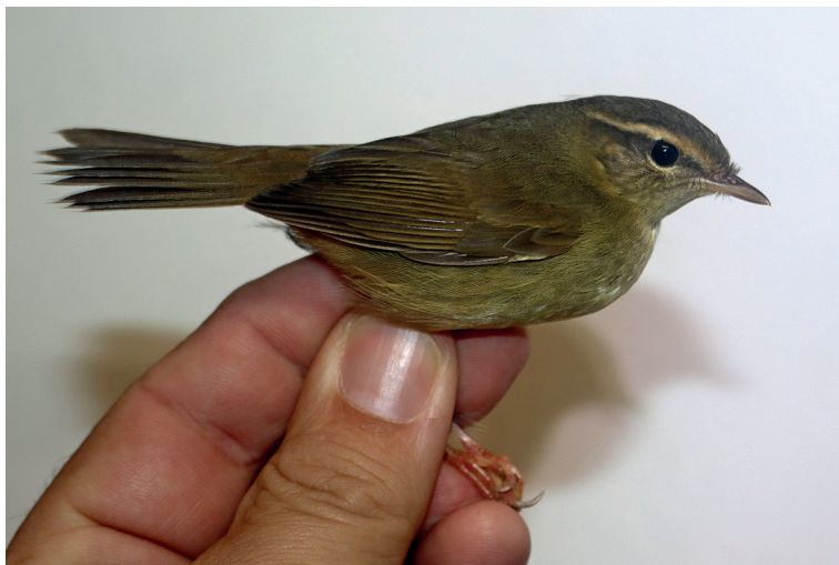
Obr. 8. Budníček tlustozobý ( Phylloscopus schwarzi ), Červenohorské sedlo (okres Šumperk), 1. listopadu 2023.

Fig. 8. Radde's Warbler ( Phylloscopus schwarzi ), Červenohorské sedlo mountain pass (Šumperk district), 1 November 2023.