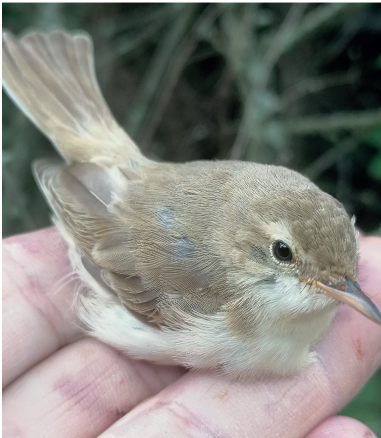
Obr. 9. Sedmihlásek malý ( Iduna caligata ), Biskupice (okres Zlín), 3. září 2023. Fig. 9. Booted Warbler ( Iduna caligata ), Biskupice (Zlín district), 3 September 2023.