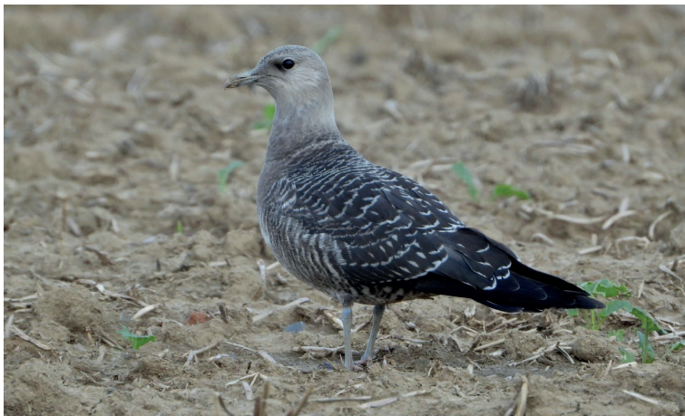
Obr. 4. Chaluha malá ( Stercorarius longicaudus ), Velké Albrechtice (okres Nový Jičín), 3. září 2023.

Fig. 4. Long-tailed Jaeger ( Stercorarius longicaudus ), Velké Albrechtice (Nový Jičín district), 3 September 2023.