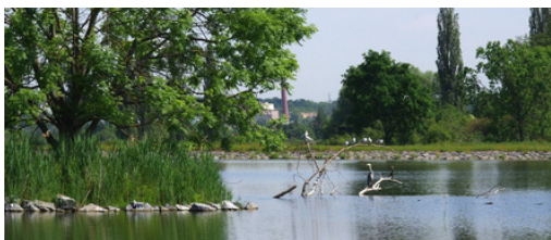
Litožnický rybník

Od března do září se zapojilo 31 lidí, kteří zkontrolovali 91 rybníků . Většina dat ale pochází z Prahy, kde zároveň běžel projekt Za ptáky Prahy. Výsledky tedy odrážejí hlavně situaci v Praze a nelze je vztahovat na celé Česko.