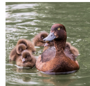
Rodinka poláků chocholaček.

Rybníkem s největším průměrným počtem druhů i jedinců byl pražský Litožnický rybník. Průměrně jsme zde při jedné návštěvě zaznamenali 8,7 druhů a 75 jedinců vodních a mokřadních ptáků. Jde o velký rybník s rozsáhlými litorály v klidové zóně. Má všechny předpoklady být rybníkem pro ptáky, což dokazují i pozorování ptáků.